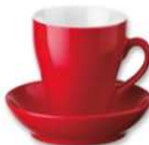
ФЛЖАНКА НА СПОДАЧКУ